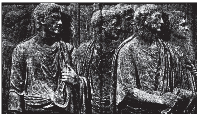
Imagine cu basorelieful împăratului Traian, alături de căpeteniile sale.