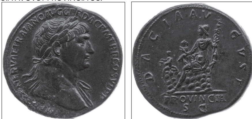
Moneda romană din bronz care circula în Provincia Dacia, în anii 112-114. Reversul ei a fost ales ca siglă revistei Dacia .

În plan secundar, apar doi copii, ca simbol al prosperității provinciei Dacia, ce se dezvoltă sub auspiciile armatei romane. Unul este așezat pe o altă stâncă, având în mână un ciorchine de struguri, iar celălalt așezat pe genunchiul drept al femeii, cu un spic de grâu 2 . Pe marginile monedei, sub formă circulară apare scris DACIA AVGVST PROVINCIÆ SC.