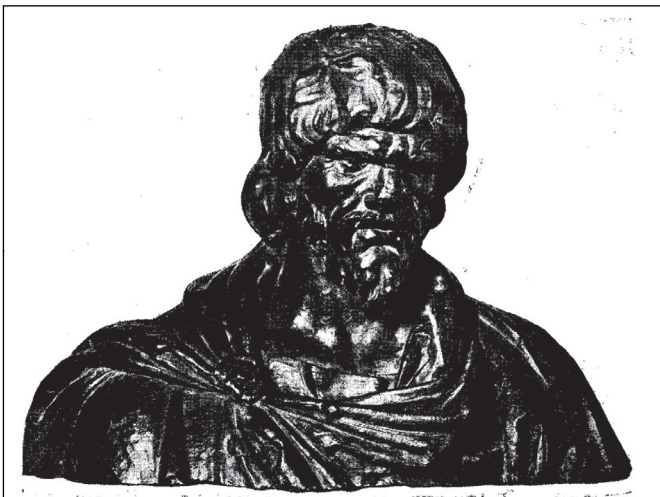
imagine cu basorelieful unui rege dac.