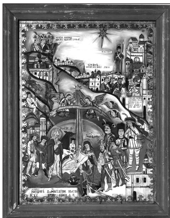
Fig.4-Nașterea Domnului