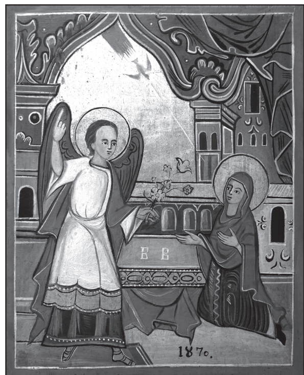
Fig.2-Buna Vestire