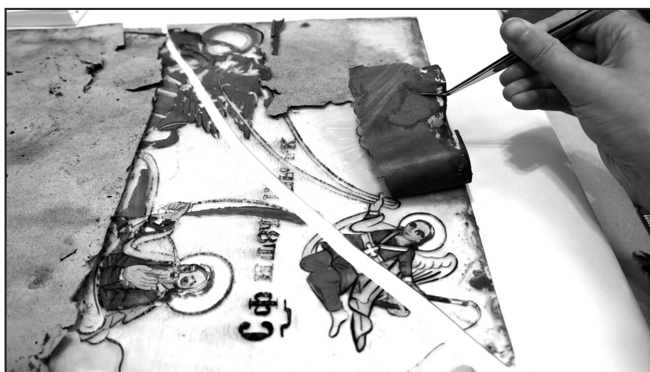
Fig.5-Detaliu din timpul restaurării unei icoane pe sticlă