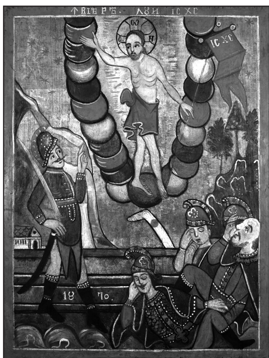
Fig.3-Învierea Domnului