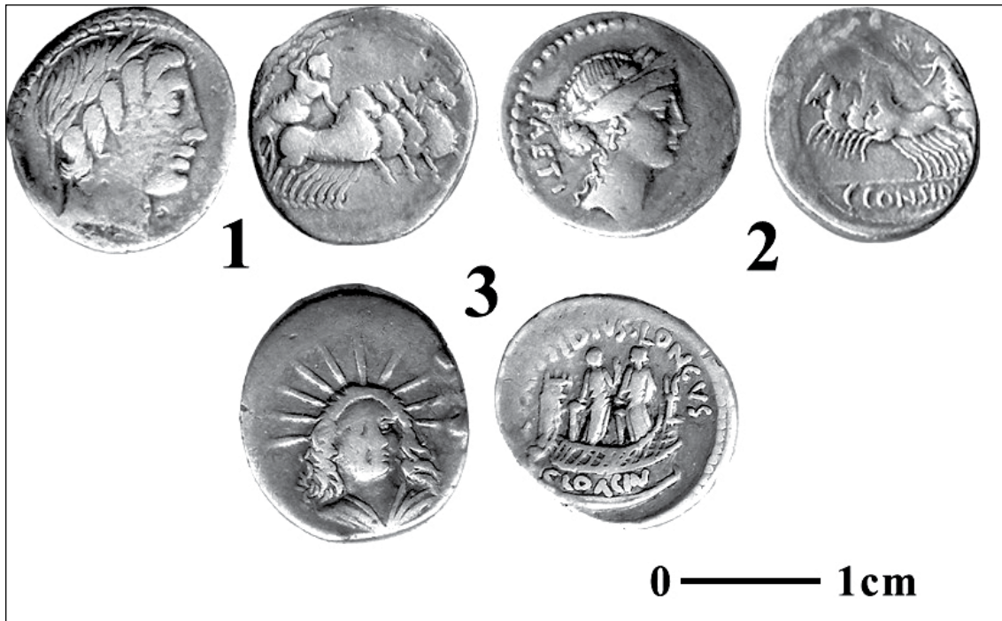
Planșa 2. Monedele din Colecția Muzeului Județean Vâlcea aparținând tezaurului de la Goranu: 1/957, 2/955, 3/956.