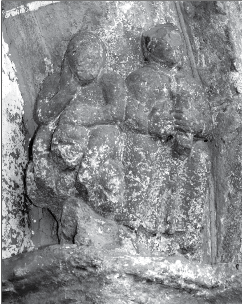
Lupta Credinței cu idolatria, portal vest, biserica evanghelică din Avrig, România