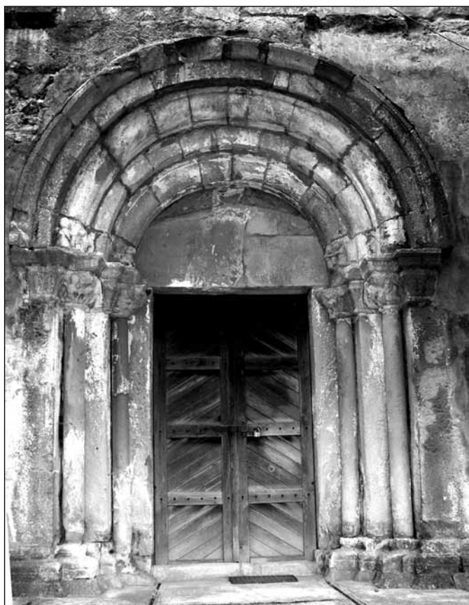
Portal vestic, biserica luterană din Săcădate, România