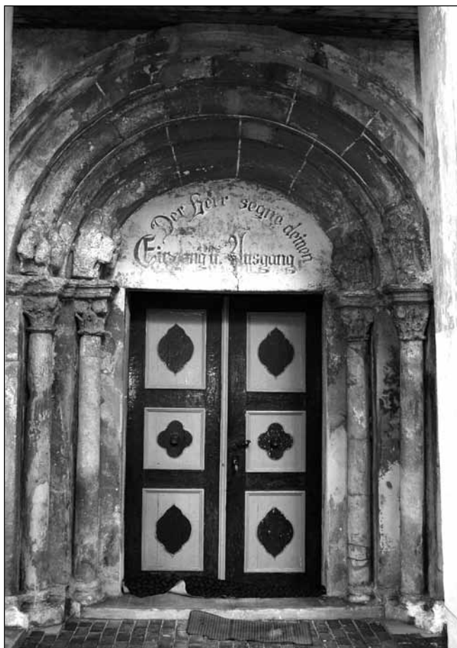
Portal vestic, biserica evanghelică din Avrig, România