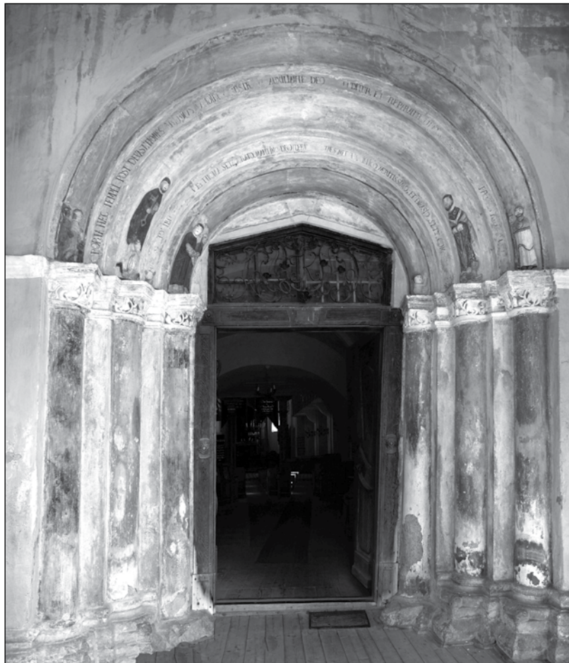
Portal de vest, biserica evanghelică din Hosman, România