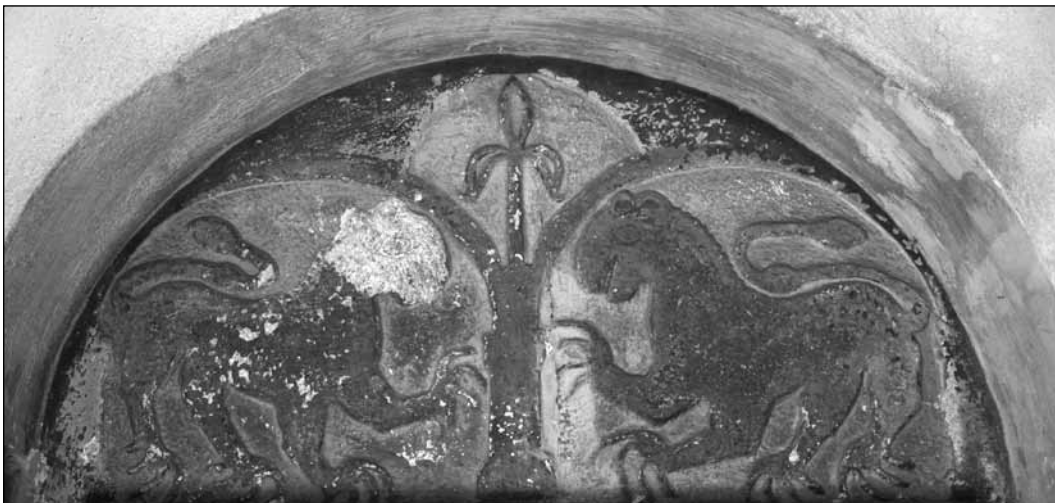
Arborele vieții, portal vest, biserica evanghelică din Ocna Sibiului, România