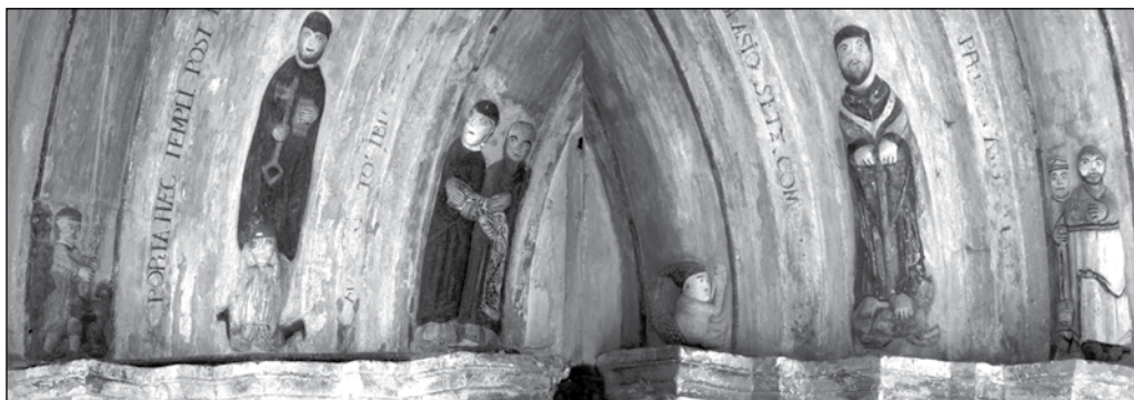
Arhivolte, portal vestic, biserica evanghelică din Hosman, România