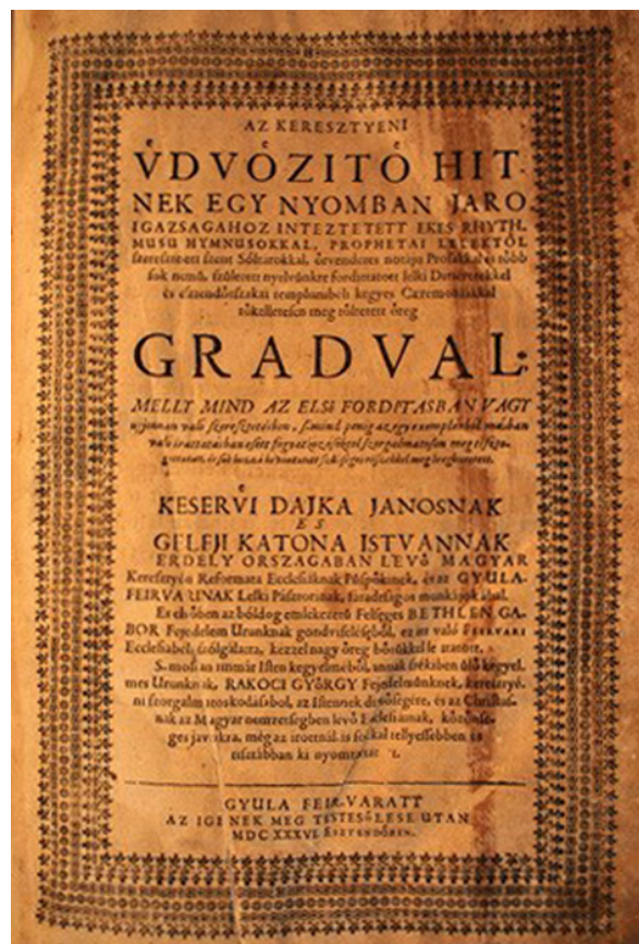
Öreg Graduál 44

Într-o colecție parohială, la Târgu Mureș se mai păstrează, la Biserica de pe strada Gecse, un exemplar din Öreg Graduál , aflat în stare bună de conservare 42 . Această culegere de cântece bisericesti a fost donată de Principele Gheorghe Rákóczi I, după cum se poate observa din dedicația cu semnătura sa. A fost dată în folosința cantorului, el fiind lăudat pentru activitatea depusă în slujba bisericii, după cum rezultă din însemnarea în versuri din anul 1710 43 .