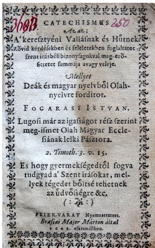
Catechismul lui Fogarasi 41

vallásnak, 1648, a lui István Fogarasi, pastorul românilor din Lugoș 40 , o cărticică cu 48 de file, în limba română, cu ortografie maghiară adaptată. La Biblioteca Academiei din București se păstrează un facsimil al acestui catechism. Alte lucrări cu conținut polemic sunt de exemplu Péter Dengelegi, Roevind anatomia , 1630; Pál Keresztúri, Christianus Lactens , 1637, István Geleji Katona, Praeconium Evangelicorum , 1638.