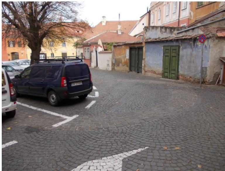
Planșa 1. Urmele fostei rotonde marcate în piatra cubică a Pieței Huet

Îndeosebi ultimele cercetări arheologice au pus în evidență existența acestei clădiri etajate, cu diametrul interior de 7,20 m, grosimea zidului de 0,90-1,20 m și stâlp central cu diametrul de circa 1 m, asemănătoare celei cercetate la Oraștie 17 , urmele ei fiind marcate astăzi în piatra cubică a pieței (planșa 1).