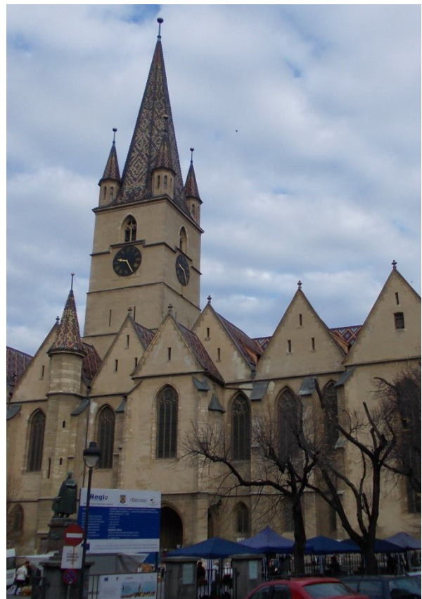
Planșa 4. Biserica Evanghelică din Sibiu (2014)

altă construcție (capelă?) prezentă la un moment dat în piață și care prin amplasament obturează porticul sudic. Elementul surpriză este apariția la partea estică a bisericii a unei structuri în plan circular, o clădire etajată, care poate să ofere pentru prima dată în policromie, o imagine a dispărutei rotunde. În panoul pictat, clădirea este plasată mai spre sud decât în realitate, acest fapt însă poate fi doar un joc al perspectivei legat de locul din care a fost pictată scena, clădirea bisericii redată în plan secund fiind ilustrată cu o înălțime mai mică. La partea superioară a turnului (presupusa rotundă), construcția este fortificată prin goluri de tragere și „guri de scurgere”, iar etajul inferior este caracterizat de ferestre dreptunghiulare. Clădirea este acoperită cu un coif conic de culoare roșie, posibil din metal, lemn vopsit sau țiglă, retras față de marginea superioară a zidăriei. Dacă nu este vorba de un turn de apărare ci de rotundă, lipsa fragmentelor de învelitoare ceramică constatată în urma cercetării arheologice îi dă însă mult mai puține șanse acestui din urmă element de construcție 25 .