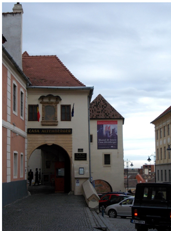
Planșa 5. Casa Altemberger. Muzeul de Istorie (2014)

voievodul transilvănean referitor la plata taxelor sau la protecția împotriva nobililor, Universitatea Națiunii Săsești le-a luat apărarea adeseori, ca unora care aparțineau de drept aceleiași națiuni 30 . Reprezentarea de la Șoroștin, simbolicul drum al Golgotei, comemorat în fiecare an de credincioșii catolici în preajma sărbătorii Pascale, ar putea da și din acest punct de vedere un sens iconografiei, având rolul de păstrare în memoria colectivă a momentelor dificile prin care comunitatea a trecut de-a lungul timpului, dar și dorința de a rămâne integrați Universității Națiunii Săsești, reprezentate aici prin biserica parohială, beneficiare a drepturilor câștigate prin celebra Diplomă de la 1224 cunoscută în literatura istorică sub numele de „Andreanum”.