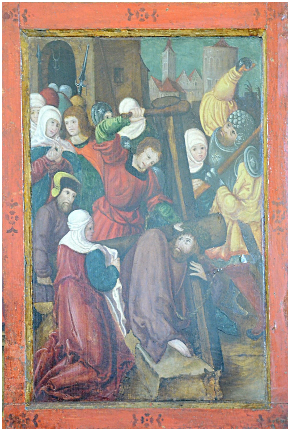
Planșa 3. Panoul pictat cu tema Purtarea crucii, polipticul de la Șoroștin (jud. Sibiu)

Panoul prezintă o scenă evanghelică, des întâlnită în ciclul narativ al Patimilor , apreciat de iconografia apuseană, redă simbolical drumul al Golgotei, mai precis momentul ieșirii din Ierusalim spre locul Răstignirii 24 .